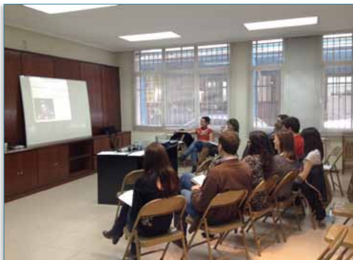
Imagen 07 > Cursos presenciales

Ayuntamiento de Vitoria-Gasteiz y a través del servicio para personas inmigrantes “Norabide”, se organizó un curso de cuatro horas. Para el Ayuntamiento Alegría-Dulantzi se organizó una sesión de sensibilización de dos horas, mientras que con el Ayuntamiento Zalla se organizaron dos cursos para dos centros de estudio de diez horas de duración, y con el Ayuntamiento de Zumarraga tres cursos de dos horas con las AMPAS del municipio. Con el Ayuntamiento de Aretxabaleta se organizó una charla de dos horas y con el Ayuntamiento de Ermua un curso de ocho horas para el funcionariado. En colaboración con el Ayuntamiento de Barrika también se organizó una sesión formativa de dos horas de duración.