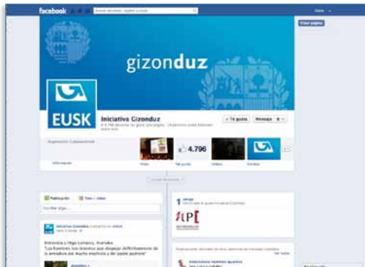
Imagen 04 > Presencia en la web > Redes Sociales: página en Facebook