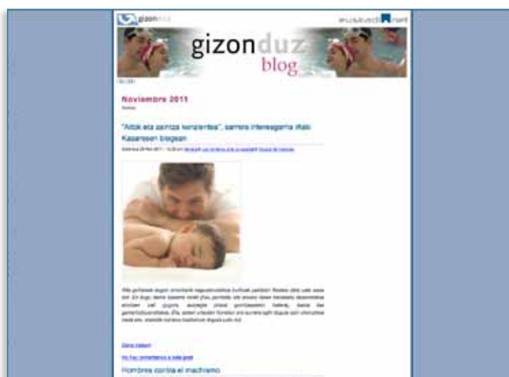
Imagen 02 > Presencia en la web > Blog

Desde enero a diciembre de 2011, se subieron 120 entradas clasificadas según las siguientes categorías: iniciativas institucionales, violencias masculinas, violencia contra las mujeres, grupos de hombres y los hombres frente a la igualdad.