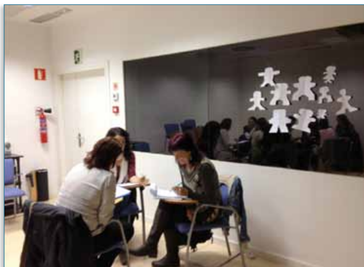
Imagen 08 > Cursos presenciales

En cuanto a la valoración de los cursos, el 91% de las personas participantes los consideraron útiles para su vida personal y un 76% también para su vida profesional. Por otra parte, Emakunde a través de Gizonduz tomó parte en actividades de sensibilización organizadas por otras entidades, entre las que cabe destacar: