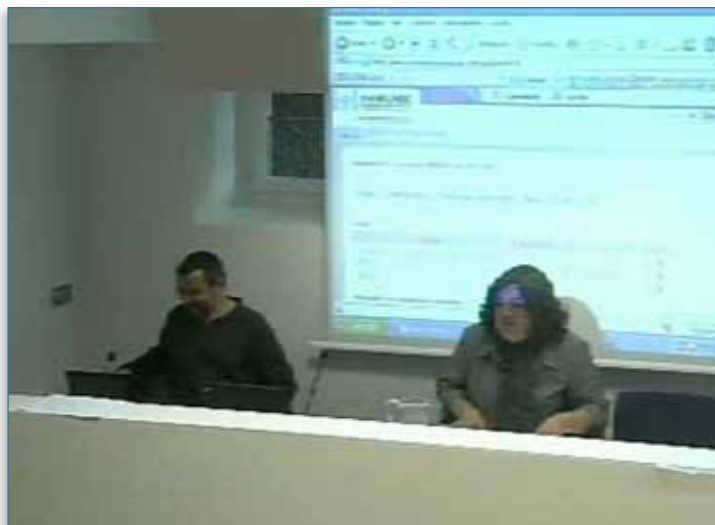
Imagen 11 > Formación online

En el foro habilitado en la plataforma para que los alumnos y alumnas que no habían podido asistir personalmente a la sesión presencial pudieran realizar los comentarios pertinentes, se realizaron 111 intervenciones de más de 70 alumnos y alumnas.