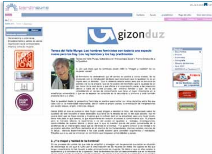
Imagen 03 > Presencia en la web > Entrevistas en www.gizonduz.com