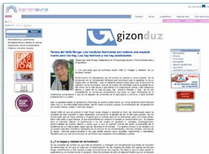
Imagen 03 > Presencia en la web > Entrevistas en www.gizonduz.com