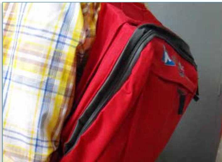
Imagen 05 > Materiales formativos > Mochila Gizonduz para padres

En febrero de 2011 se dio fin a esta iniciativa puesta en marcha en 2008, consistente en la distribución de alrededor de 30.000 mochilas con diversos materiales de sensibilización dirigidos a dar pautas sobre cuestiones relacionadas con el cuidado y la paternidad, así como a aportar claves para reflexionar sobre la influencia de la figura paterna en la transmisión de valores no sexistas. En concreto estos materiales, en cuya elaboración se contó con el patrocinio de Caja Laboral, son los siguientes: el documental «Aitak», el cuento «El Secreto de Aita», la guía «Padres en Igualdad», la guía «Los hombres, la igualdad y las nuevas masculinidades», el juego «Berdinometroa», una pegatina para colocar en el coche y el periódico Gizonduz.