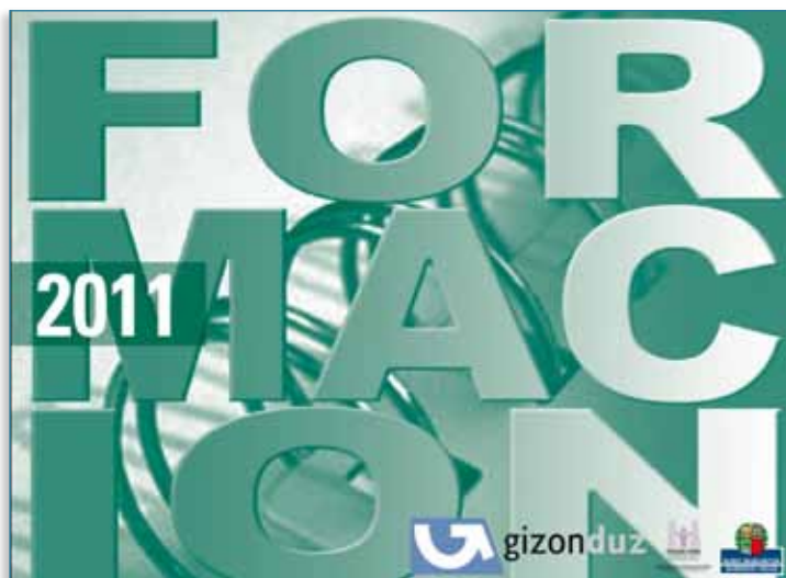
Imagen 06 > Materiales formativos > Programa de formación y sensibilización

Durante el año 2011, en la tercera edición del programa se impartieron un total de 76 cursos (74 presenciales y dos online de 60 y 8 horas) en los que participaron un total de 1650 personas, de las que el 55,6% (919) fueron hombres y el 44,4% (731) fueron mujeres.