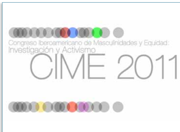
Imagen 09 > Congresos > CIME 2011