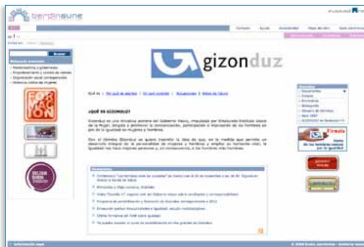
Imagen 01 > Presencia en la web > www.gizonduz.com

En cuanto a la utilización de idiomas para acceder a la página, el 91% de las personas lo han hecho en castellano, frente a un 3% que lo ha hecho en euskera y un 1,5% en inglés.