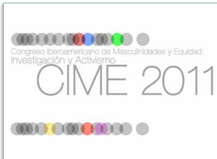
Imagen 09 > Congresos > CIME 2011